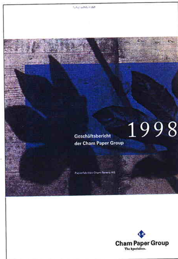
Cham Paper Group: Beispiel eines Geschäftsberichts, der grundlegend neu konzipiert und im Full Service extern konzipiert und realisiert wurde.

lange nicht alle Probleme. Weitaus entscheidender ist, dass sich das Unternehmen bewusst ist, welches Bild es von sich selber nachhaltig (!) vermitteln will. Das erfordert eine intensive und kontinuierliche Zusammenarbeit und eine hohe Bereitschaft des Unternehmens, sich selbst verstehen zu lernen.